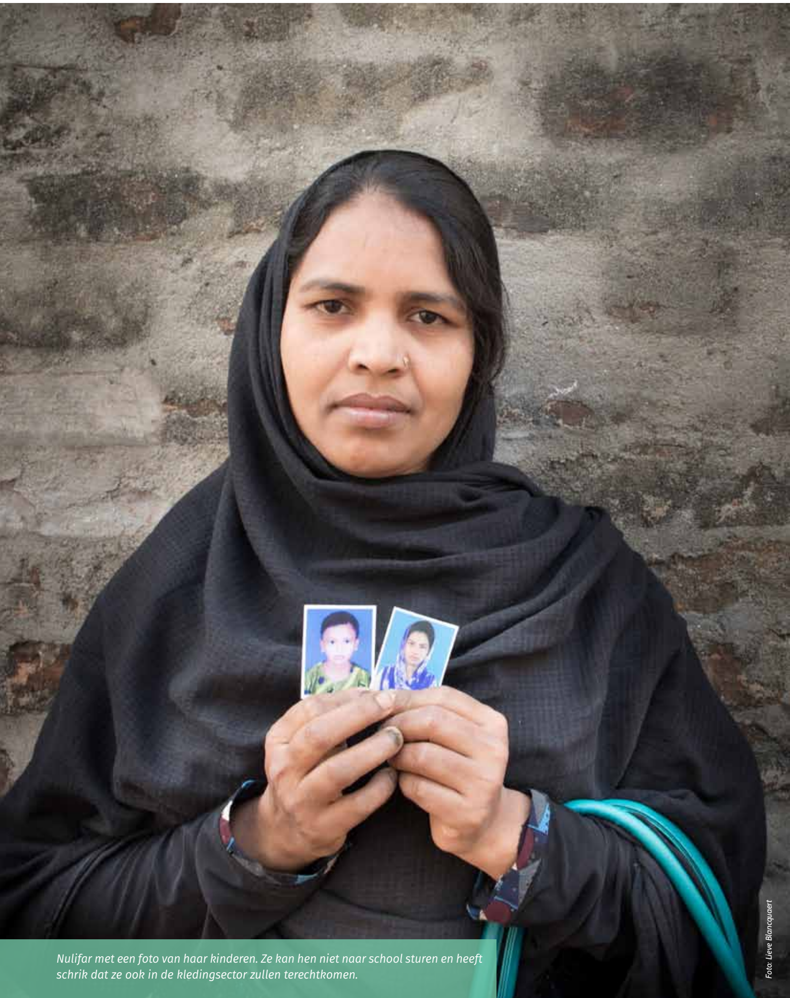
Nulifar met een foto van haar kinderen. Ze kan hen niet naar school sturen en heeft schrik dat ze ook in de kledingsector zullen terechtkomen.