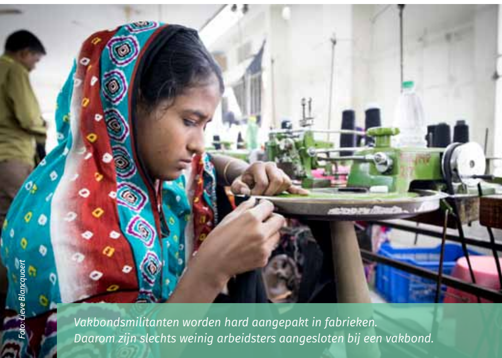
Vakbondsmilitanten worden hard aangepakt in fabrieken. Daarom zijn slechts weinig arbeiders aangesloten bij een vakbond.

Verschillende grote kledingketens dokeerden, anderen ontweken hun verantwoordelijkheid en hielden de boot af. Pas als vakbonden en ngo's voldoende druk zetten, gaven ze toe. Uiteindelijk werd op 8 juni 2015 het beoogde bedrag volledig opgehaald. Dat wil zeggen dat het meer dan twee jaar heeft geduurd voor genoeg geld ingezameld was om de slachtoffers te compenseren. Voor velen gaat het om bedragen van niet meer dan 1000 euro, zelfs als ze levenslang arbeidsongeschikt zijn. Slachtoffers die veel medische kosten hebben door psychische of fysieke verwondingen die ze vijf jaar geleden opliepen, komen daar niet mee toe. Bijlange niet.