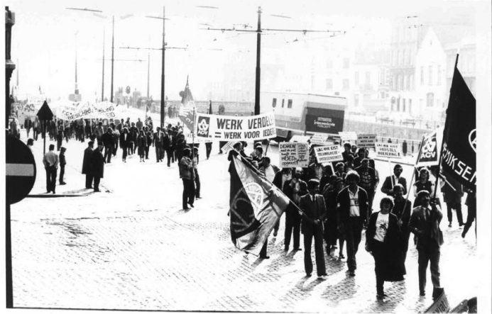
Betoging tegen de werkloosheid en voor een betere werkverdeling (Brussel, 1982)

Door de experimenten Hansenne (1982) bijvoorbeeld kon de werkgever tijdelijk afwijken van de wetten en cao's rond arbeidsduur, nachtarbeid, zondagsrust en feestdagen, op voorwaarde dat hij extra arbeidsplaatsen creëerde. Het ACV deed er alles aan om een goed beschermend statuut te bedingen voor de betrokken werknemers.