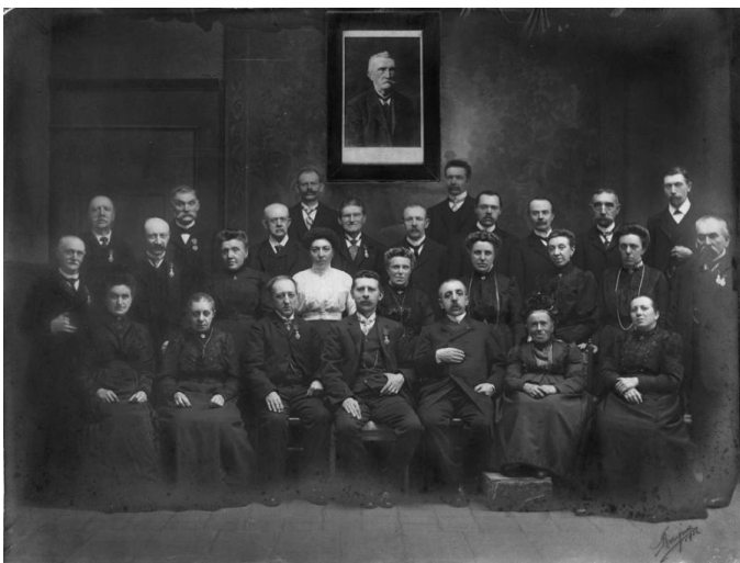
Vrije Katoenbewerdersbond Recht en Plicht, viering 25-jarig bestaan, Gent, 1912

Vanaf het midden van de 19 de eeuw ontstonden de eerste vakverenigingen in Gent en omgeving. Aanvankelijk waren deze eerste nog zeer kleine vakverenigingen politiek en ideologisch neutraal. Maar de invloed van het socialisme liet zich steeds meer gelden. Er