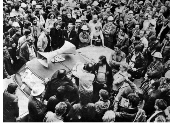
Bedrijfsbezetting, Athus, syndicale bijeenkomst, 1977

Rond 1960 zag de overheid het nut van multinationals in voor de werkgelegenheid en lokte zij hen met grote subsidies naar ons land. Maar al snel bleken ook de nadelen: het gemak waarmee veel buitenlandse ondernemingen een afdeling sloten of verhuisden, zorgde voor grote werkonzekerheid. De werknemers namen daarom in de jaren 1970 een nieuw actiemiddel in de hand: de bedrijfsbezetting.